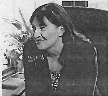
Bündnis 90/Die Grünen ist eine politische Partei in Deutschland, die sich v.a. für die Themen Umwelt und soziale Gerechtigkeit interessiert.

b Ja! Ich bin Politikerin geworden, um etwas zu verändern. In Deutschland ist nicht alles immer gut gelaufen - zum Beispiel bei der Integrations-, Energie- und Sozialpolitik. Ich wollte etwas tun, damit sich etwas ändert. In der Integrationspolitik war mir besonders