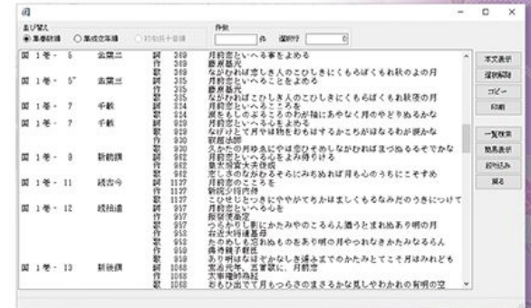
▲「歌題・歌枕・用語等検索」における検索結果一覧の例(月前恋)