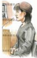
覚せい剤所持・使用 1年6月求刑